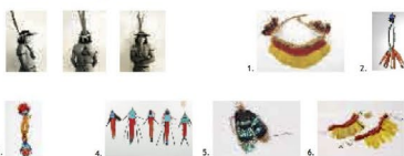
Urubu-Kaapor, Maranhão Fotografias de Curt Nimuendajú de um Urubu-Kaapor usando adornos plumários 1. Diadema de fios de algodão e penas de arara canã, mutum, pomba trocal e papagaio Awa-Tukanivar. 2. Colar apito - Colar masculino com pingentes de mosaico de penas de anambé azul, apito de osso de galvão e penas de mutum e arara canã. 3. Colar feminino com medalhão e pingente dorsal com penas de tuacano anambé azul e arara canã. 4. Tembete. Estofete labial de pena de arara vermelha com mosaico nas extremidades de penas de anambé azul. 5. Par de brinco em mosaico de penas coladas de anambé azul e arara vermelha. 6. Par de braceleiras com uma heira de plumas vermelhas de arara canã intercaladas com penas amarelas de Japu.