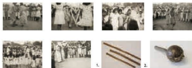
Fulni-ô de Águas Belas, Pernambuco Fotografias da cerimônia do Toré. 1. Búzios 2. Maracá