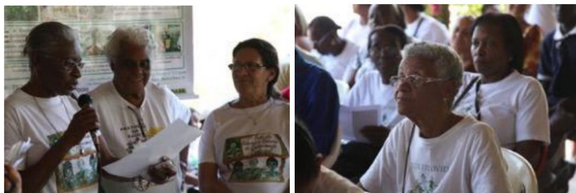
Fotos 2 e 3: Discussão em plenária sobre as terminologias a serem adotadas pela Associação, Encontro de Partilha, 2012, Paraty, RJ.

estou preparando os produtos?”, “O que faço (qual o nome dos produtos)?”, “Onde faço (qual o nome do espaço utilizado)?”. Os termos mais recorrentes nos eventos regionais foram levados ao Encontro Estadual de Partilha, realizado no quilombo do Campinho da Independência, em Paraty, em 16 de setembro de 2012. Nessa ocasião, primeiramente foram escolhidas as melhores definições que, em seguida, foram votadas pela plenária. As duas primeiras perguntas obtiveram consenso na escolha dos termos ao final das duas etapas: agentes do conhecimento tradicional e produtos naturais das plantas medicinais. A escolha destes termos é bastante emblemática. Não pertenciam ao vocabulário cotidiano das pessoas que os escolheram e estão associados aos termos utilizados pela literatura sobre patrimônio imaterial, expressando uma estratégia da Rede Fitovida para alcançar seus objetivos no reconhecimento do papel de seus integrantes na preservação desses saberes.