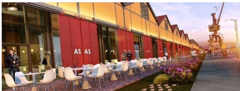
Imagem 3: Projeto para área dos Armazéns no Cais Mauá. O espaço contará com restaurantes e áreas públicas.