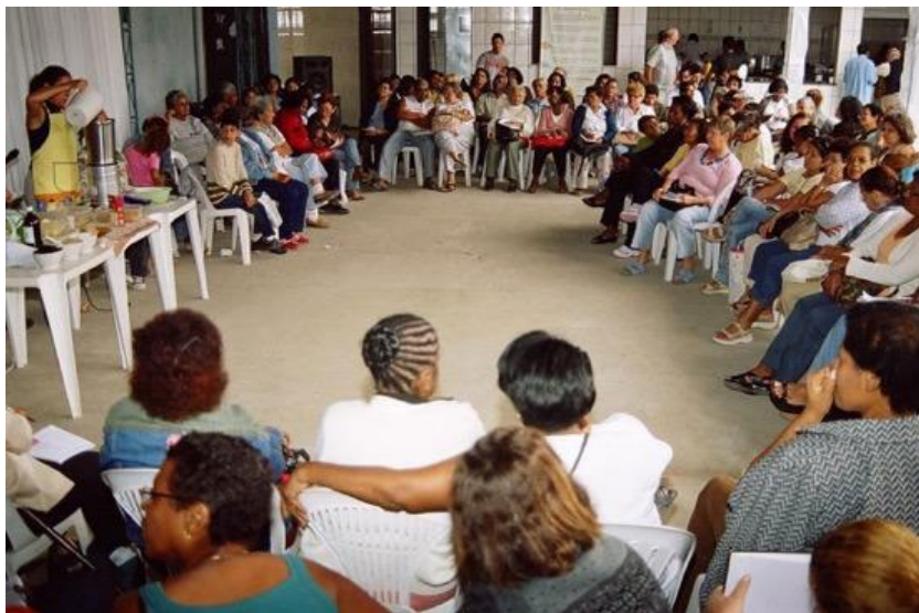
Foto 1: XX Encontro de Partilha, Nova Iguaçu, RJ, 2006. Tema: Alimentação Natural.

Os grupos se organizam em cozinhas alternativas ou salas de saúde e produzem semanalmente uma quantidade de remédios caseiros, que são doados ou vendidos a preço de custo: xaropes, pomadas, garrafadas, sabão, leite forte, tinturas, multimisturas, vermífugos, sachês de chás, xampu, sabonetes, óleos medicinais, entre outros produtos.