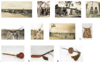
Kanela - Rokamkomekra, Rio Corda Maranhão Conjunto de Fotografias de Curt Nimuendajú durante o ritual Krokrit. 1. Brinquedo miniature de máscara Krokrit (to Kalveju) trançada com sarja e fios de buriti Máscara de dança Krokrit (Itaka) trançada em sarja com palha e fio de buriti 2. Maracá de Cabaça 3. Buzina de cabaça com cabo de taboca e trançado com tala de buriti e fios de algodão 4. Maracá de cabaça, com vareta de madeira e pingentes de fios de algodão.