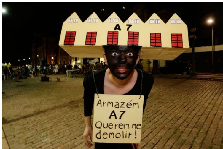
Imagem 6: Manifestação em prol do Armazém A7 organizada por artistas de rua na Rua Sepúlveda, em frente ao pórtico de entrada do Cais Mauá.