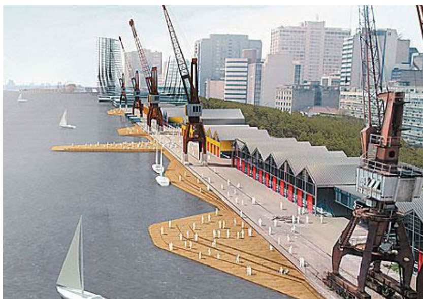
Imagem 4: O projeto para as áreas dos Armazéns dos 11 guindastes existentes manterá quatro revitalizados.