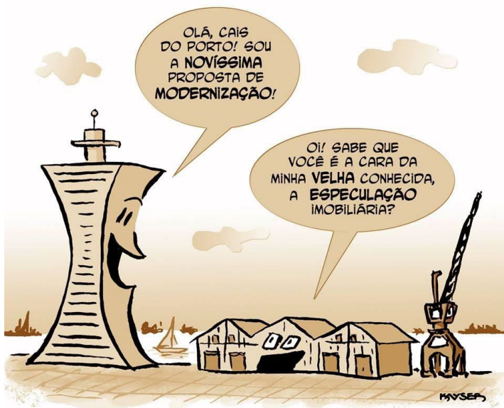
Imagem 11: