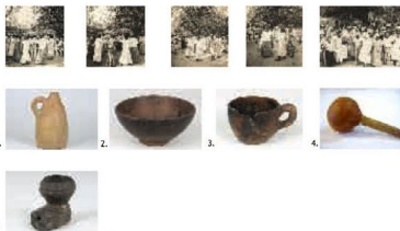
Tremembé, Almofofa, Ceará Fotografias da Dança do Torém Tremembé. 1. Garrafa de cerâmica com alça 2. Tigela de cerâmica usada para o consumo da bebida Mocororó 3. Cuiá (xicara) com alça usada para o consumo do Mocororó 4. Maracá de cabaça 5. Cachimbo de cerâmica