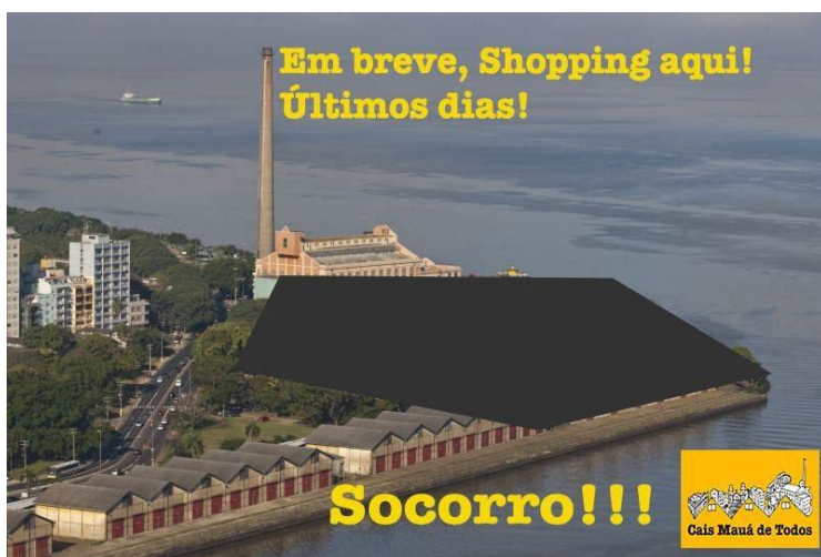
Imagem 08: