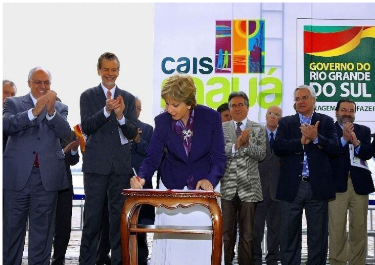
Imagem 5: Momento da assinatura do contrato de concessão da área do Cais Mauá pela então governadora Yeda Crusius, em 2010.