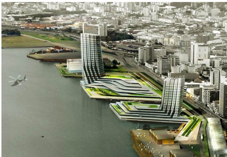
Imagem 10: