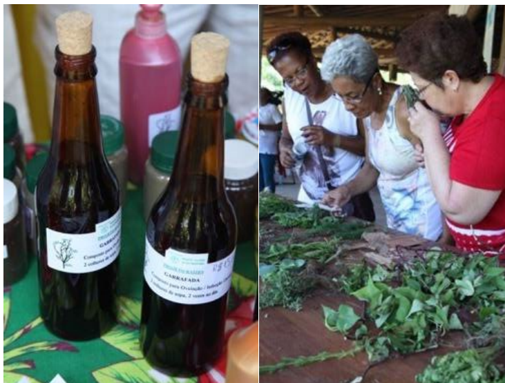
Foto 5 (à esquerda): Remédios caseiros vendidos e trocados nos encontros com selo da marca Rede Fitovida.