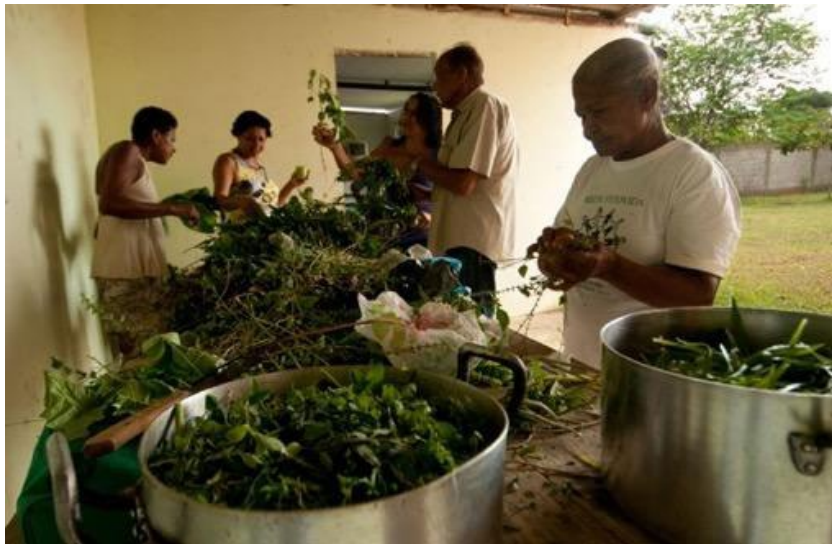
Foto 4: Oficina de Xarope e Pomada na Igreja de São Benedito, em Japeri, RJ, 2013.

Há uma característica recorrente entre seus muitos integrantes: o primeiro contato com as plantas medicinais aconteceu no ambiente familiar. Isto não significa que tenham acumulado conhecimento através do aprendizado com seus parentes, pois muitos só começaram a conhecer plantas e a fazer remédios após se aproximarem dos grupos. A crença na eficácia das plantas medicinais é o ponto de partida para estabelecer uma relação e passar a consumir os remédios caseiros e está baseada em uma memória afetiva e em uma visão de mundo segundo as quais a natureza possui atributos divinos.