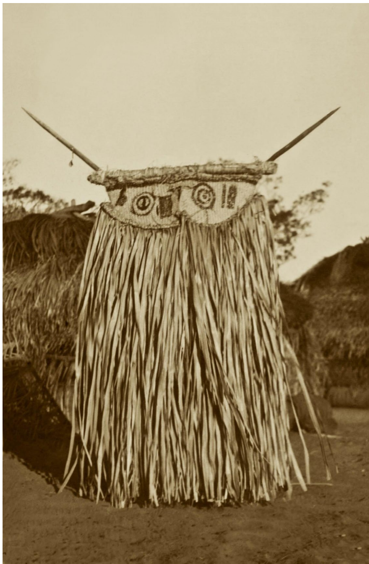
Fig. 8. Uma das fotografias de Curt Nimuendajú da máscara usada na festa do Kokrit entre os Ramkokamekra, de 1935, foi usada na exposição na aldeia Escalvado