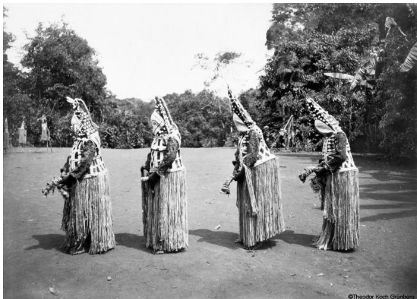
Fig 3. Máscaras Kubeo fotografadas por Koch-Grünberg, 1903

Assim, na apropriação dos conteúdos etnográficos que descrevem os objetos preservando a sua trajetória como objetos de pesquisa, isto é, nas mãos do pesquisador, o objeto obedece às ordens de seu novo curador e realiza uma nova viagem para o mundo privado ou público. Neste sentido, se faz necessário buscar alternativas para melhorar a documentação dos objetos de coleções etnográficas que se encontram em museus. E esse trabalho deveria ser com a colaboração dos povos indígenas. Os museus poderiam aproveitar-se muito bem de representantes indígenas para apoiar em um modelo colaborativo as ações de documentação de objetos etnográficos.