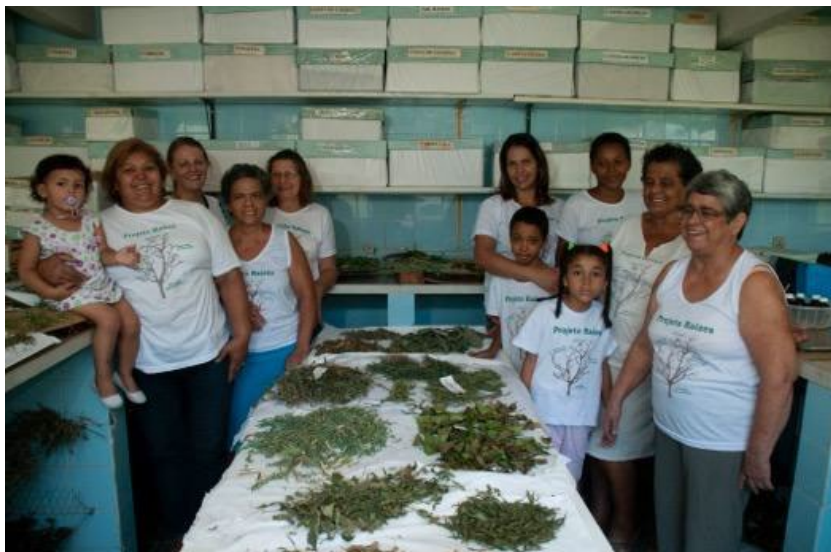
Foto 7: Grupo Projeto Raízes funciona em uma Unidade Básica de Saúde, em Barra Mansa, RJ, 2012.

É preciso ressaltar que a PNPMF e a Política Nacional de Práticas Integrativas e Complementares – PNPIC (Brasil, 2006) foi elaborada para definir de que maneira essas práticas de cuidado devem ser utilizadas na Atenção Primária à Saúde, no âmbito do Sistema Único de Saúde. Ainda que critérios como segurança, qualidade e eficácia sejam características fundamentais para a promoção do cuidado com a saúde e o uso esteja restrito às formas complementares e integrativas, tais políticas reconhecem o papel dos saberes populares sobre plantas medicinais no autocuidado e estimulam seu uso, sobretudo na Estratégia Saúde da Família (ESF). É curioso que para a Rede Fitovida a possibilidade de interação com as políticas públicas de saúde não tenha avançado. Muitos integrantes dos grupos são agentes comunitários de saúde, que não só conhecem, mas também atuam na ESF. Vale ressaltar que o grupo Raízes, em Barra Mansa, e a Casa de Memória da Rede Fitovida, em Belford Roxo, estão