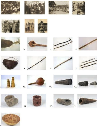
Pankararu, Brejo dos Padres, Tacaratu, Pernambuco Fotografias: Bebida do Ajucá, celebração do Ajucá, Flechamento do Umbú, Cestas da Festa das Corridas do Umbú, Menino sendo abençoado pelos Pralás, Toré Pankararu, Pralá Pankararu. 1. Máscara (fragmentos) de Pralá feita de palha de Crot com parte de penas. 2. Maracá de cabaça usado pelos Pralás e cantadores nas festas ritualizadas. 3. Gancho de madeira tosca usado pelos Pralás no Ritual do Menini-no-Rancho com decoração recortada na casca da madeira. 4. Búzio cilíndrico oco de madeira rústica usado no Ritual. Menino-no-Rancho. 5. Máscara feita de cabaça recortada, usada pelos figurantes do toré. 6. Cacete dos Padrinhos do Menino-no-Rancho, madeira branca com vestígios de desenhos em vermelho e preto. 7. Cacete de Dança do Menino-

no-Rancho em madeira tosca esculpindo com formas humanas (antropomorfas). 8. Varinhas de madeira tosca com decoração recortada na casca, usado para marcar os cestos usados no ritual das Corridas-do-Umbú. 9. Apito feito de rabo de tatu peba usado por um dos tocadores durante a Queima da Canção na festa das Corridas-do-Umbú. 10. Maracá de cabaça. 11. Cachimbo de cerâmica usado pelos índios do Nordeste. 12. Cachimbo de argila. 13. Cachimbo de fornilho - cerâmica ornamentada 14. Cachimbo de fornilho de pedra vermelha. 15. Cachimbo tubular de barro, ornamentado com desenhos incisos. 16. Cachimbo tubular de raiz de jurema usado pelo chefe do cerimonial na festa do ajucá. 17. Tigela de barro decoradas com desenho em vermelho e branco usados na festa do ajucá.