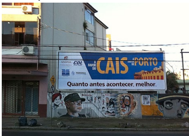
Imagem 1: Outdoors da campanha do Cais Mauá já estavam nas ruas de Porto Alegre em 2011.

Nas palavras do urbanista Rafael, a grandiosidade do projeto, além de não levar em conta o tamanho da área, restringe a quantidade de atores que poderiam participar da proposta de revitalização. Considero esta entrevista importante por ter sido realizada em um momento no qual já havia sido desenvolvido trabalho de campo, com discernimento do que era realmente relevante para ser dialogado com o entrevistado. Os grandes projetos de negócios e a carência de planos urbanísticos que acompanham estas transformações foram as pautas dessa entrevista. Assim, a “operação urbana consorciada” surge como uma alternativa a este modelo de empreendimento.