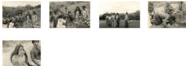
Tuxá, Bahia Fotografias da festa da Jurema