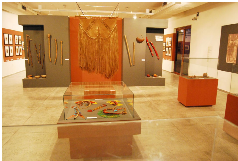
Fig.5 Fotografia do detalhe da exposição no painel no fundo à direita as duas novas flautas/Toré Fulni-ô em vermelho.

Na ocasião, foi sugerido aos Fulni-ô que preparassem um novo par de búzios para a coleção. Realizamos o projeto e os búzios foram confeccionados pelos Fulni-ô em Águas Belas. No dia da abertura da exposição, um grupo de Fulni-ô esteve presente com músicas apropriadas e utilizadas em suas festas. Na ocasião, os búzios deteriorados foram substituídos pelos novos. Ao introduzir os novos búzios na exposição, foi alcançada a atualidade que se queria dar à coleção, tornando-a contemporânea com a participação indígena na montagem dos objetos. Ao realizar a exposição com os objetos que foram recolhidos por Carlos Estevão no início do século passado, recortando-se aspectos bastante específicos de objetos de uso xamânico, mostrou-se o seu uso no presente pelos próprios índios.