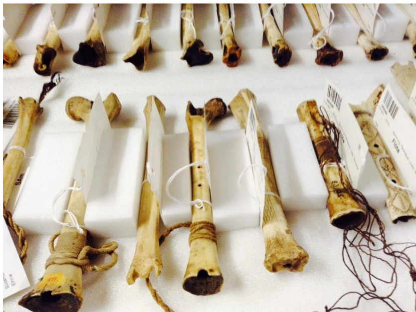
Fig.1. Gaveta na reserva técnica com as flautas de osso no Weltmuseum Wien

sendo elas visualizadas, porém, apenas pelos homens. Ou seja, mulheres não podem ver essas flautas nas cerimônias de Jurupari. Os tons musicais específicos de um determinado clã, produzidos por pequenas flautas, possibilitam a abertura de uma caixa contendo todos os ornamentos dos ancestrais deste clã, que estarão presentes na festa nos corpos dos grupos de irmãos que lideram com base nesses objetos vivos. Entre outras interpretações da caixa de enfeites, Stephen Hugh-Jones sugere que a caixa dos ornamentos, que era mantida na interior maloca e aberta durante as festas e ao som desta pequena flauta de osso, “é um operador espaço-temporal, uma manifestação do sol, um ser vestido com uma brilhante coroa de penas que ordena a passagem do tempo” (Hugh-Jones, 2014, p. 161).