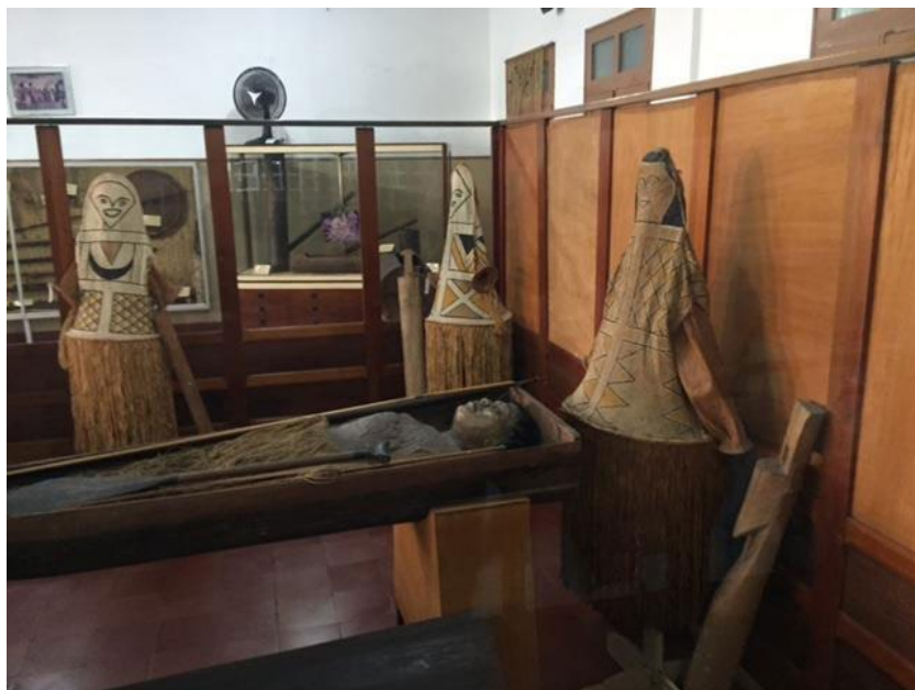
Fig. 2. Três máscaras que se usam em danças, dispostas numa instalação no Museu do Índio em Manaus

Um outro exemplo que acho importante destacar aqui é o das máscaras que foram retiradas de diversas aldeias indígenas da região do Alto Rio Negro, e que podemos encontrar também em muitos museus. Talvez a mais famosa delas seja aquela que se encontra no Museu Pigorini, em Roma, cuja história está detalhada no diário do Frei Illuminato Coppi, que se vangloria de a ter retirado deliberadamente da aldeia Tariana de Yauaretê no ano de 1890, eliminando o “culto ao Diabo” (Rodrigues, 2017).