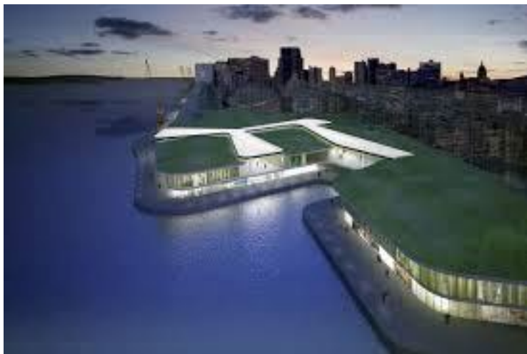
Imagem 07:

Imagens do empreendimento, que visa à construção de um shopping e três grandes prédios, associadas àquelas produzidas pelos movimentos contrários à revitalização.